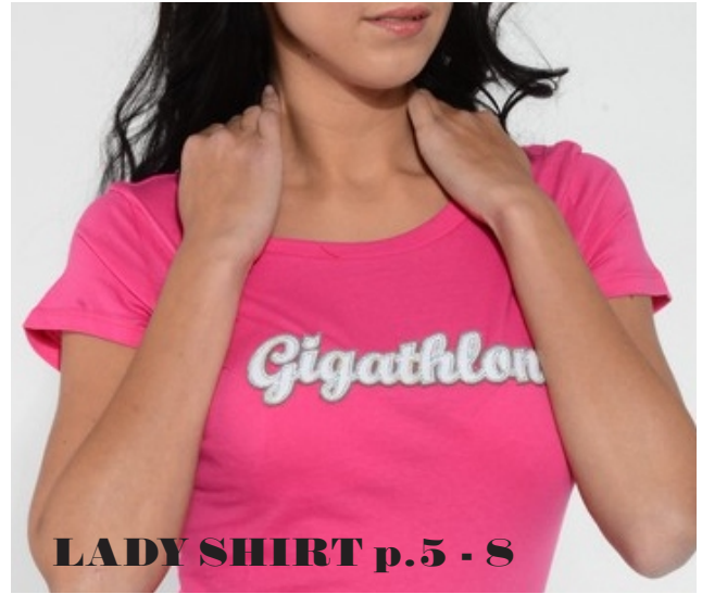
LADY SHIRT p.5 - 8