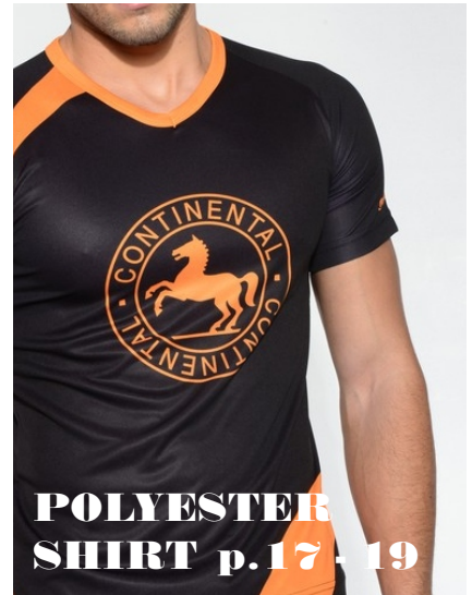
POLYESTER SHIRT p.17 - 19