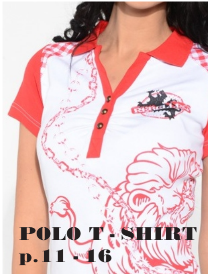
POLO T - SHIRT p.11 - 16