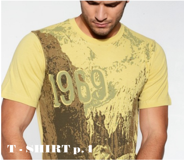
T - SHIRT p.4